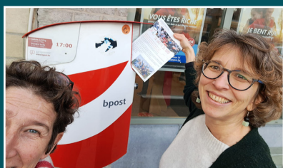
TOUTES LES ANTENNES BDBD - 1 er envoi en publipostage de la Gazette de BdBd !!!