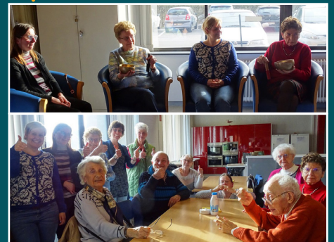
NIVELLES - Goûter hebdomadaire. En février : initiation aux bols tibétains.