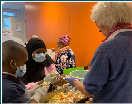
ANDERLECHT - 1 er atelier culinaire - intergénérationnel - en partenariat avec la CSD.