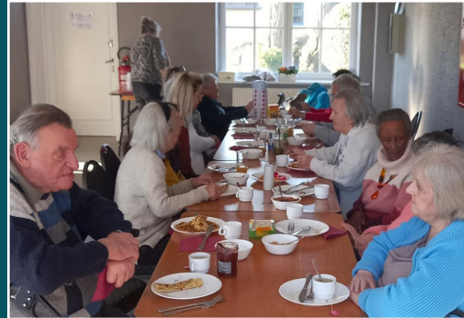
RIXENSART - Moment collectif à l'occasion du goûter mensuel.