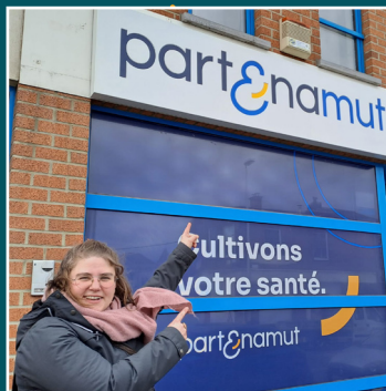
LA LOUVIÈRE - L'agence de Partenamut accueille l'antenne d'Amélie. Permanence les lundis entre 9h et 16h30 et les jeudis entre 9h et 13h Uniquement sur rdv : 0493/41 87 27