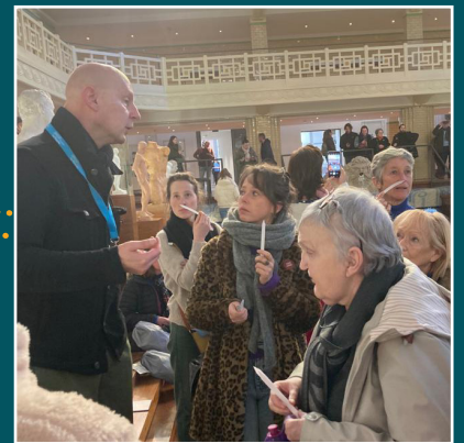
OTTIGNIES-LLN & WALHAIN - 3 ème excursion dans le cadre du projet "Vie et Art". Ici à la Piscine de Roubaix.