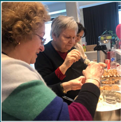
FOREST - Mardi Soupe hebdomadaire au Miro.